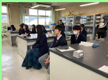
熱心に耳を傾ける2年生